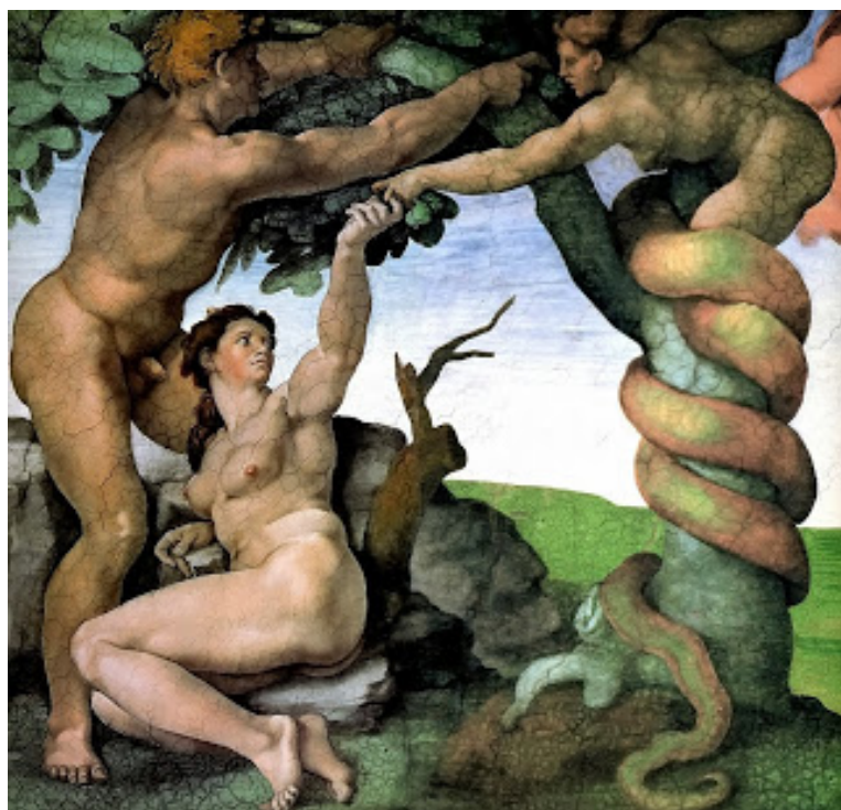
Lilit frestar Adam och Eva – Michelangelo

Och myten röjer att Lilit födde hundra små demoner dagligen, lilims, och levde ett fullvärdigt liv.