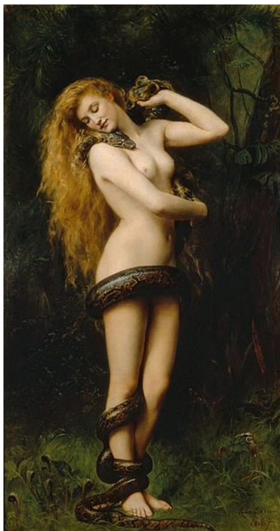
Lilit - John Collier, 1892

Det gick inte Adam med på, och då var storgrälet på gång. Lilit insisterade - att Gud skapat dem av samma skrot och korn, av jord, till man och kvinna. Med vilken rätt skulle Adam hävda en ensamrätt till något? Då vände sig Adam till Gud och klagade över Lilits beteende mot honom. Men då fick Lilit nog och bestämde sig för att lämna Adam. Hon uttalade en magisk tabuformel, Guds hemliga namn 1 , och flög iväg. Myten berättar att hon landade någonstans vid Röda havet och bosatte sig där i en grotta.