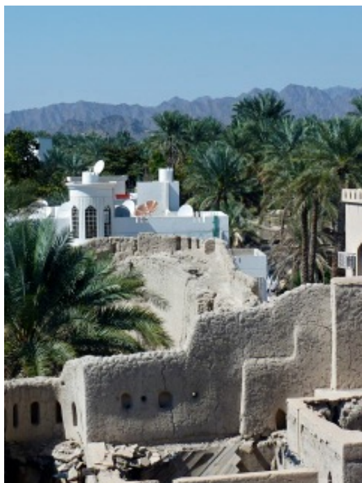
Gammalt och nytt i norra Oman.

I början av 2000-talet införde sultanen rösträtt för alla medborgare över 21 år, med undantag av polis och militär.