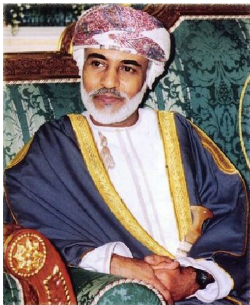
Hans majestät Sultan Qaboos bin Said al Said. (Officiellt porträtt.)

Oman håller sig politiskt neutralt och har normala förbindelser med Iran samtidigt som det är allierat med Storbritannien och USA 3 . Man kan säga att Oman upprätthåller en balans mellan västvärlden och Iran. Qaboos fredspolitik har gjort Oman till en av de mest stabila länderna i arabvärlden som annars ständigt skakas av krig och kriser. Att många idag oroar sig för Omans framtid efter sultanens bortgång är helt förklarligt. Vem är kapabel att bära hans mantel?