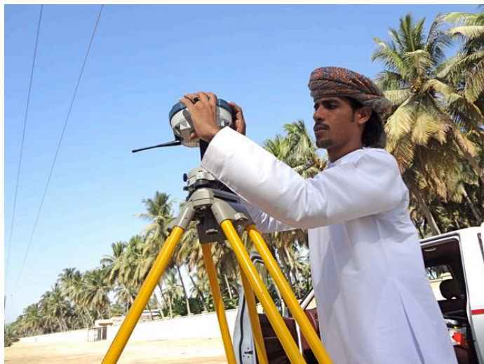
En lantmätare på uppdrag att markera var en ny väg ska dras.

Sökandet efter olja startade på 1920-talet men kom först igång i kommersiell skala 1967 och utgör idag 75 procent av landets intäkter. Oljereserverna förväntas vara uttömda inom 30 år 7 och därför har det blivit viktigt att söka efter andra näringar för att säkra allas rätt till fortsatta möjligheter till försörjning. I takt med att oljepriset sjunkit det senaste decenniet har