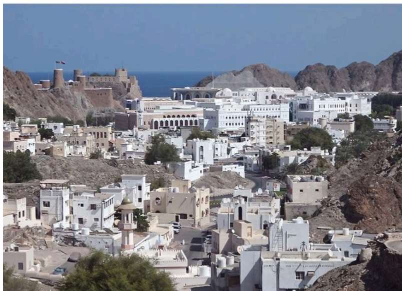
Omans huvudstad Muscat ("gömd"). Till vänster Al Jalali-fortet som portugiserna byggde vid hamninloppet på 1600-talet. På sommaren stiger termometern upp till 50 grader Celsius.

Oman var länge ett totalt instängt land under dess förre despotiske sultan Said bin Taimurs styre (1932–1970) då landet hette Muscat och Oman. Sultanen hade förbjudit turismen, innehav av radioapparater, att cykla, och till och med något så bisarrt som att använda glasögon. Eller vad sägs om att det var straffbart att råka se honom i sina drömmar när man sov! Hans misstänksamhet mot bankerna gjorde att han bevarade sitt eget guldinnehav "under madrassen". Sant eller inte, så tyckts allting ha varit förbjudet, även resandet från inlandet till kusten och vice versa. Ett besök i huvudstaden Muscat krävde dessutom sultanens personliga tillstånd. Inga politiska yttranden var tillåtna och fängelserna var överfulla. Det förekom flera upprorsförsök, även ett mordförsök, tills hans 30-årige son Qaboos ersatte honom genom en oblodig palatskupp och den gamle försattes i exil i London där han två år senare dog och begravdes 1 .