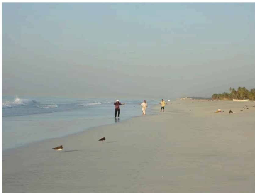
Al Dahariz South – Salalah strand efter solnedgången.

kommer till stranden för att fiska eller tävla i brottning och i andra sporter innan mörkret faller.