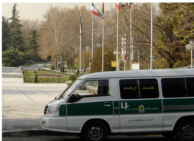
Sedlighetspatrullens van, en vanlig syn i Teheran.

och gudomliga revolutionen i denna orättvisa diskriminering och gjorde slöjan obligatoriskt för alla kvinnor! Han understryker: ”Det innebär att alla kvinnor nu fick rätten att bära hijab.”