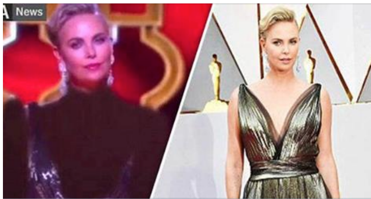
Sydafrikanska filmstjärnan Charlize Theron, en av prisutdelarna på Oscarsgalan kläddes om med photoshopdräkt (vä) på den iranska tevesändningen.

Men iranier skapar egna friare utrymmen, som myndigheter inte känner till och de skapar egen undergroundmusik. Dessutom skapar exiliranier musik utomlands som kan lyssnas i Iran på radiofrekvenser som sänts via satelliter. Facebook- och Twitterkonton är officiellt förbjudna, men man kan skaffa sig illegala proxytjänster för att komma åt sidorna. Det ordnas partyn på otaliga ställen, för vem kan kontrollera Teherans alla 14 miljoner invånare. Razzior görs löpande och det händer att grannar tipsar sedlighetsvaktare om pågående fester.