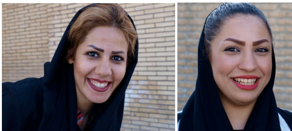
En populär form av ögonbryn som förstärkts av tatuering.

Tar man ett passfoto hos en professionell fotograf får man i handen en retuscherad bild utan rynkor och skuggor under ögonen, huden är slät och näsan mindre och rakare. Det tas för givet att alla vill se bättre ut än i verkligheten.