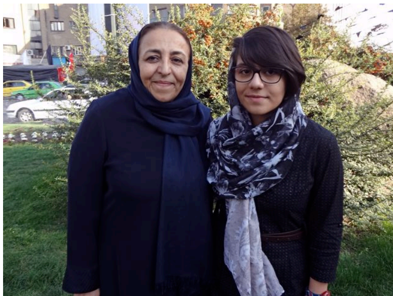
Mor och dotter, Teheran.

Under 2014 arresterades över 3,5 miljoner kvinnor i Iran därför att det fanns något att anmärka på deras obligatoriska slöjor. Sedan revolutionsåret 1979 infördes i landets konstitution att alla kvinnor måste täcka sitt hår och axlar med hijab ('hojb'=skam) som ett minimikrav.