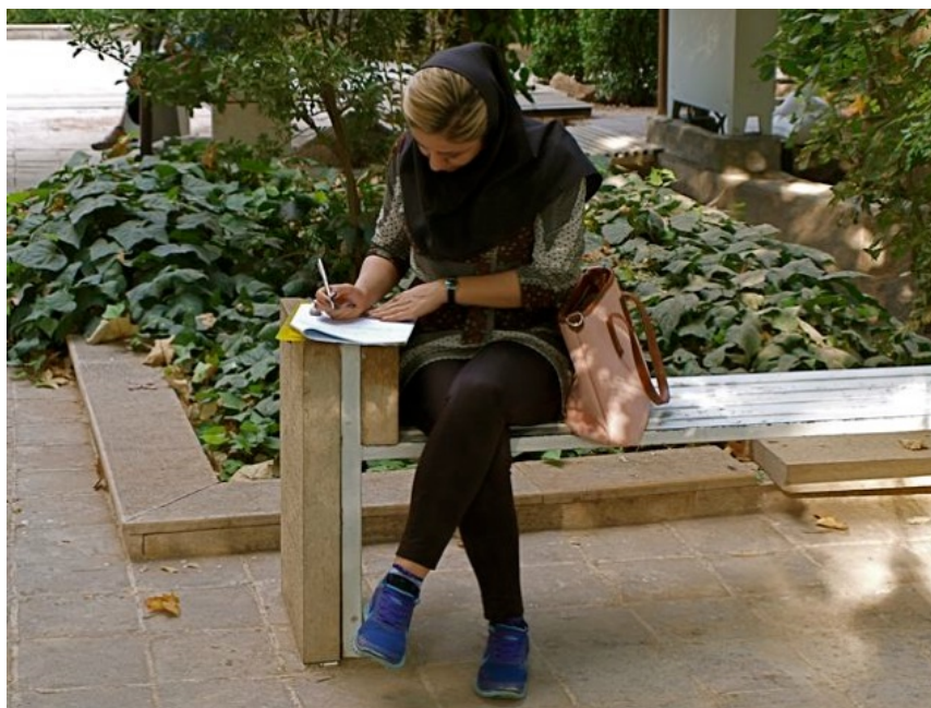
Modern hijabdress, som bekymrar ayatollorna.

Nu efteråt kan jag bara tänka mig att vi kände så stark solidaritet med det iranska folket att vi inte förmådde visa vårt missnöje mot dem såsom det kanske hade känts om vi tagit av oss sjalarna. Ingen annanstans i världen har jag, och vi, mött så oförlömligt och utan överdrift enastående vänligt folk, överallt. Hade vi fått det budskapet i resans början hade vi naturligtvis inte haft sjalen på i bussen, varför skulle vi?